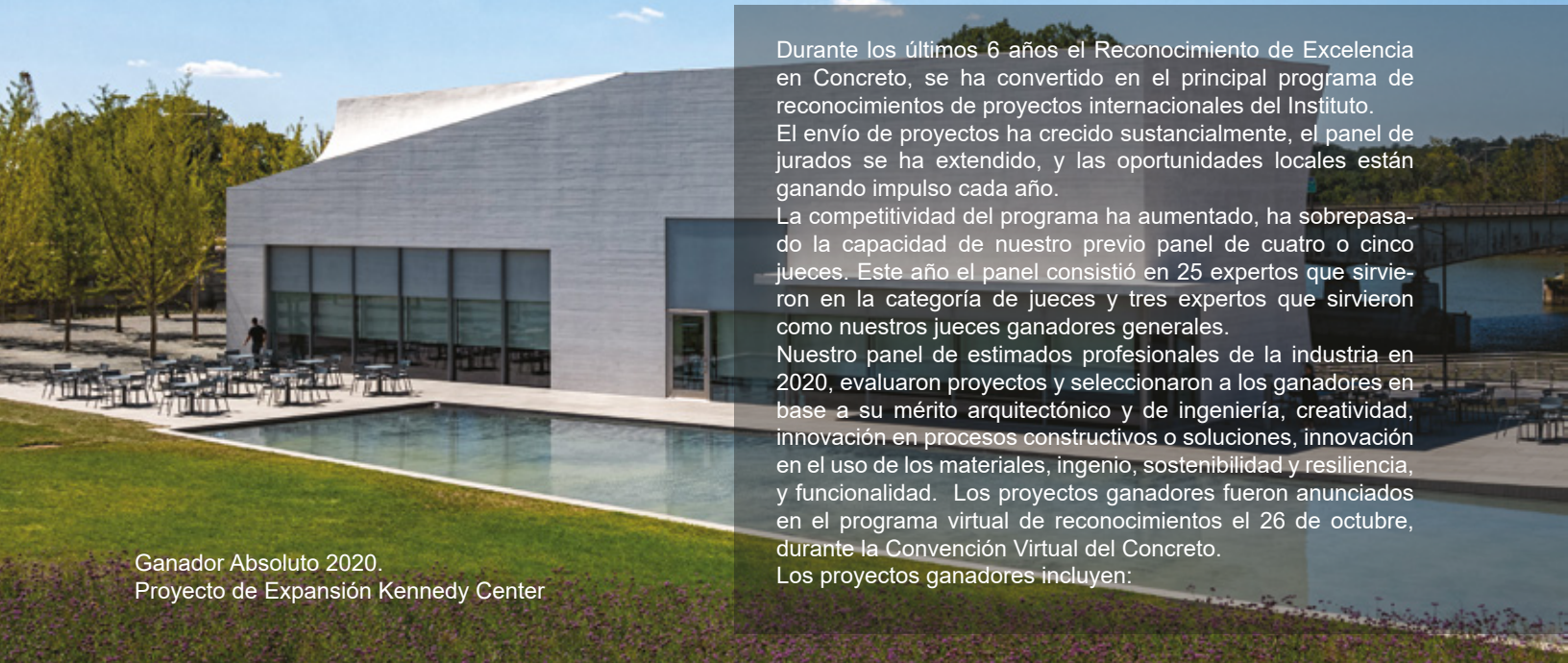
Ganador Absoluto 2020. Proyecto de Expansión Kennedy Center

Durante los últimos 6 años el Reconocimiento de Excelencia en Concreto, se ha convertido en el principal programa de reconocimientos de proyectos internacionales del Instituto. El envío de proyectos ha crecido sustancialmente, el panel de jurados se ha extendido, y las oportunidades locales están ganando impulso cada año. La competitividad del programa ha aumentado, ha sobrepasado la capacidad de nuestro previo panel de cuatro o cinco jueces. Este año el panel consistió en 25 expertos que sirvieron en la categoría de jueces y tres expertos que sirvieron como nuestros jueces ganadores generales. Nuestro panel de estimados profesionales de la industria en 2020, evaluaron proyectos y seleccionaron a los ganadores en base a su mérito arquitectónico y de ingeniería, creatividad, innovación en procesos constructivos o soluciones, innovación en el uso de los materiales, ingenio, sostenibilidad y resiliencia, y funcionalidad. Los proyectos ganadores fueron anunciados en el programa virtual de reconocimientos el 26 de octubre, durante la Convención Virtual del Concreto. Los proyectos ganadores incluyen: