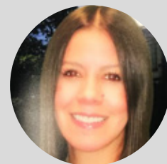
Traductor y revisor técnico : Ing. Xiomara Sapón.

Título: Reconocimientos ACI a la excelencia en construcción con concreto 2020.