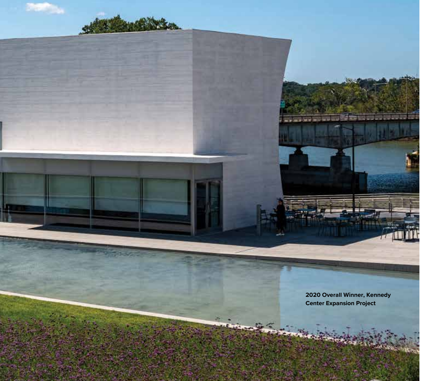
2020 Overall Winner, Kennedy Center Expansion Project