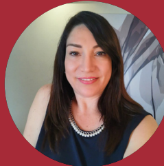
Traductor: Lic. Iliana M. Garza Gutiérrez