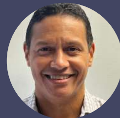
Traductor y Revisor Técnico: Ing. Julio Davis, MBA.

Título: Modificaciones a los Códigos ICC 2024