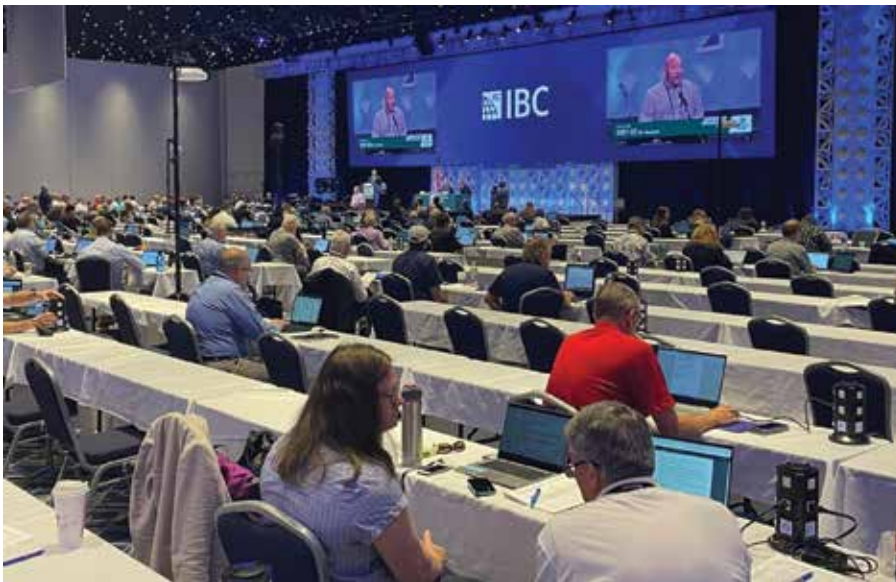
ICC 2022 Public Comment Hearing, Louisville, KY, USA

Crushed Stone Footings —A new section is added for crushed stone