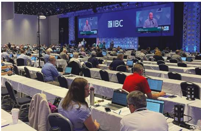
Audiencia de comentarios públicos ICC 2022, Louisville, KY, EE. UU.

Con base en los aportes y la dirección del Comité 564 de ACI, Impresión 3D con materiales cementosos, se recomendó que con la comprensión actual de la fabricación de aditivos y la falta de métodos de prueba y especificaciones de productos aplicables, el diseño y la construcción del concreto impreso en 3D deberían permanecer bajo las disposiciones de la Sección R104.11, Materiales, Diseño y Métodos de Construcción y Equipo Alternativos. Se agregó una excepción para comunicar claramente que el Apéndice AW, Construcción de edificios impresos en 3D, no se aplica a edificios impresos en 3D construidos de concreto.