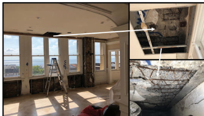
Fig. 4: Corrosión de una losa interior en un edificio histórico construido aproximadamente entre 1910 y 1911.