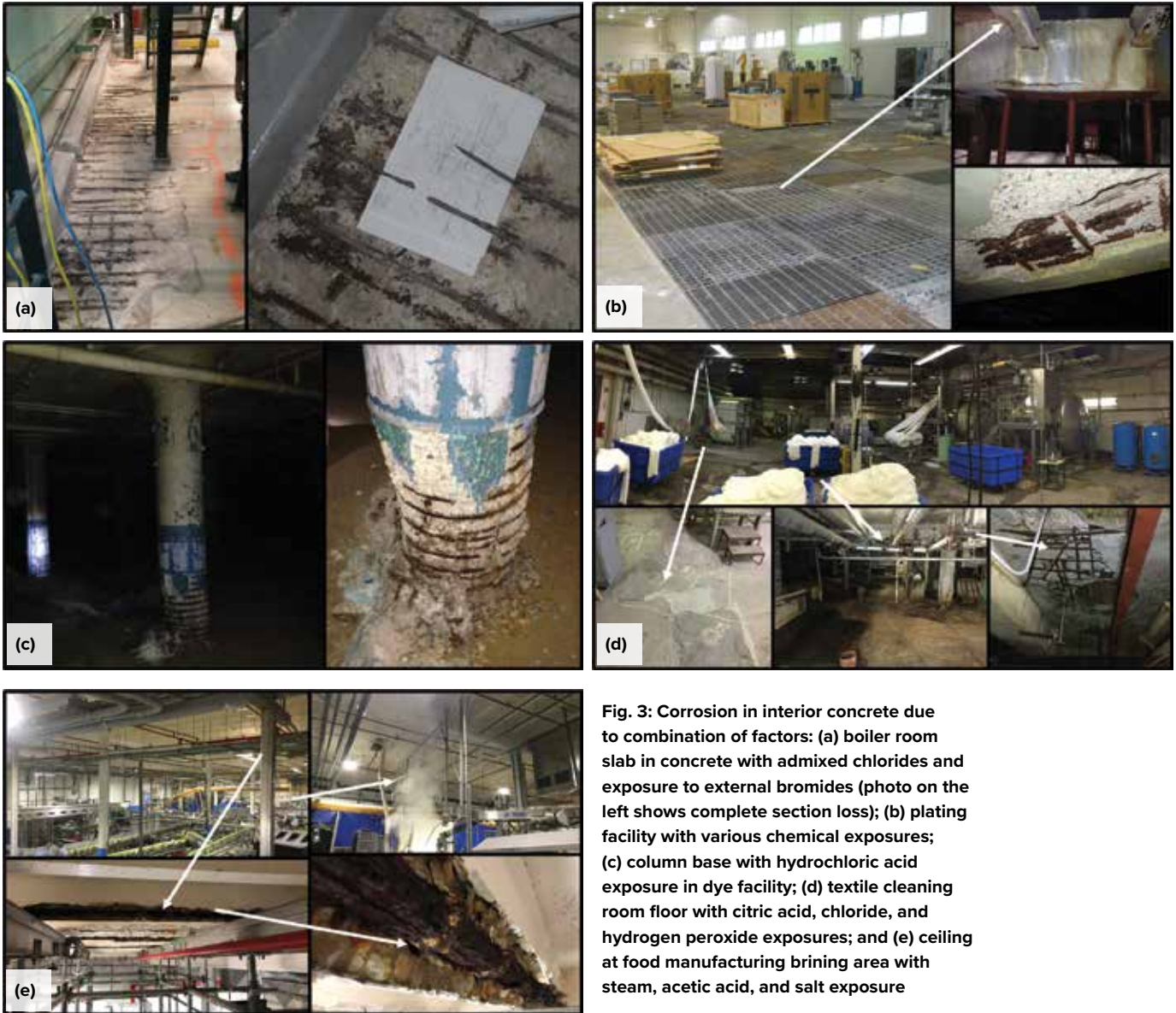
Fig. 3: Corrosion in interior concrete due to combination of factors: (a) boiler room slab in concrete with admixed chlorides and exposure to external bromides (photo on the left shows complete section loss); (b) plating facility with various chemical exposures; (c) column base with hydrochloric acid exposure in dye facility; (d) textile cleaning room floor with citric acid, chloride, and hydrogen peroxide exposures; and (e) ceiling at food manufacturing brining area with steam, acetic acid, and salt exposure

has provisions for evaluating structural damage to determine the presence of potentially unsafe conditions that might require temporary shoring until final repairs are made.