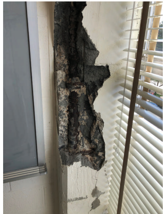
Fig. 1: Corrosión del acero de refuerzo en el concreto interior de un salón de clases debido a la activación de cloruros mezclados bajo un aumento localizado en el contenido de humedad.