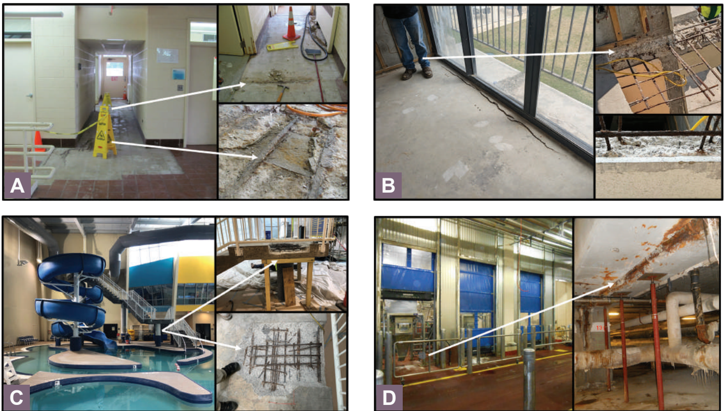
Fig. 2: Corrosión en concreto interior debido a la penetración de contaminantes como cloruros u otros haluros: (a) pasillo de instalaciones de tratamiento de agua cerca de la sala de hipoclorito; (b) interior de una unidad de condominio costero adyacente al balcón exterior en la puerta corrediza de vidrio; (c) escaleras de concreto reforzado en un parque acuático interior; y (d) área de condimentación en una instalación de fabricación de alimentos (la flecha muestra un área particularmente dañada cerca de la junta de expansión).

Aunque que la reducción de la relación a/mc puede ser un enfoque apropiado en algunos casos, el uso de MCS tales como cenizas volantes, humo de sílice o cemento de escoria; el uso de inhibidores de corrosión; o el uso de acero más resistente a la corrosión puede ser apropiado o necesario dependiendo de la vida de servicio requerida. El aumento de la resistencia a la compresión puede proporcionar un indicador de una mejor calidad general del concreto, pero se ha demostrado que, en general, no es un buen predictor de la durabilidad, sobre todo si va acompañado de un aumento del potencial de fisuración. Pueden ser útiles los ensayos basados en el rendimiento para demostrar una permeabilidad reducida, como ASTM C1876 9 (resistividad o conductividad) o ASTM C1202 10 (permeabilidad de iones cloruro). El Comité 321 del ACI, Código de Durabilidad del Concreto, está elaborando actualmente disposiciones del código de durabilidad que, con el tiempo, podrían aceptarse en la práctica.