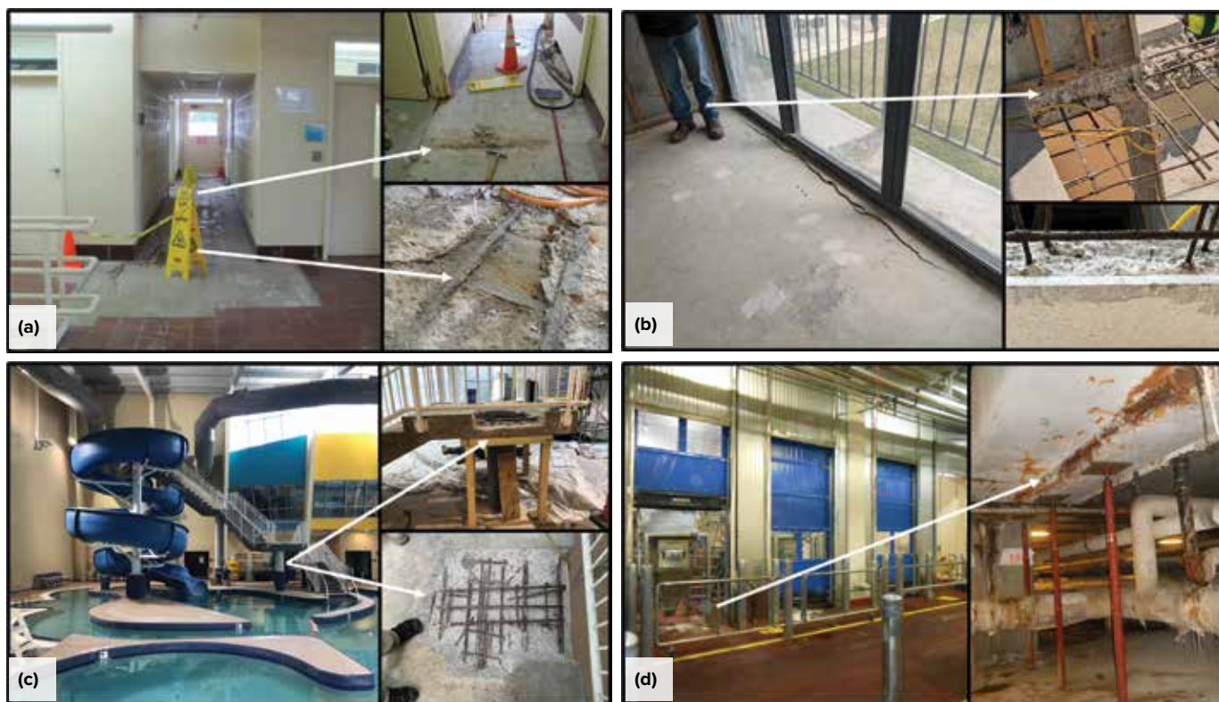
Fig. 2: Corrosion in interior concrete due to penetration of contaminants such as chlorides or other halides: (a) water treatment facility hallway near hypochlorite room; (b) interior of coastal condominium unit adjacent to exterior balcony at sliding glass door; (c) indoor water park reinforced concrete stairs; and (d) food manufacturing facility spicing area (arrow shows particularly damaged area near expansion joint)

concrete is of importance. For concrete subjected to acids or other conditions that might be corrosive to the concrete itself, reduced penetrability and external protection may be necessary. In cases where very long service life is needed or desired, increased cover or reduced penetrability can provide added protection from carbonation.