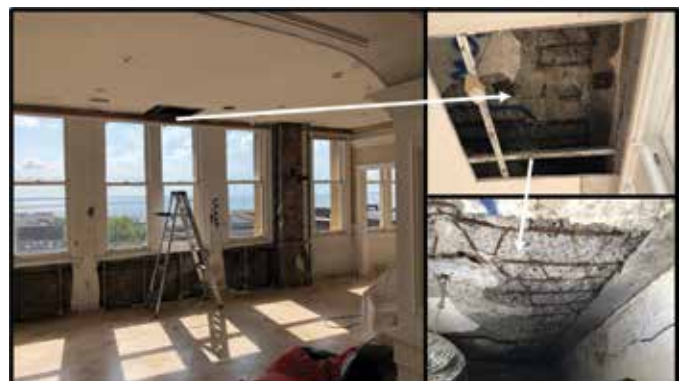
Fig. 4: Corrosion of an interior slab in an historic building constructed circa 1910-1911

Prior to the onset of corrosion, protective coatings may be used. In some cases, such as in food manufacturing facilities, compatibility with government regulations may be necessary. When corrosion commences, techniques including cathodic protection may be used. Level of damage, moisture conditions, temperature, concrete resistivity, intended service-life extension, and other factors must be considered. Practicalities of aesthetics, functionality, and monitoring also must be considered. In situations where distress and deterioration are advanced, partial or full replacement of affected areas may be needed. In these cases, compatibility of the new replacement concrete must be considered. This includes possible connection or separation of the new components with existing, load sharing, and reduction of