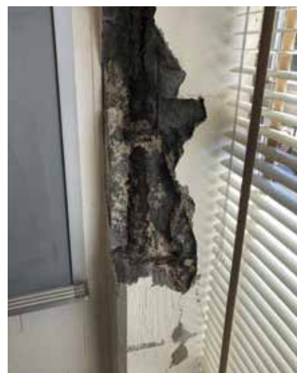
Fig. 1: Corrosion of reinforcing steel in interior concrete of a classroom due to the activation of admixed chlorides under localized increase in moisture content

ACI PRC-222.3-11 provides a number of approaches for extending the service life of structures potentially exposed to corrosive conditions. For interior structures not exposed to external corrosives or possible corrosion of the concrete that may expose steel, the primary approach is to limit the amount of chlorides cast in during construction. For structures exposed to corrosives, reducing the penetrability of concrete to corrosive substances and minimizing cracking potential of