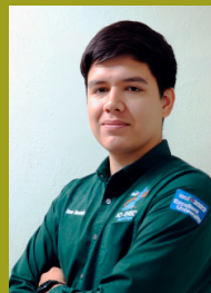
Traductora: Jesús Omar Montaño Montaño Estudiante Ing. Civil Universidad de Sonora

La traducción de este artículo correspondió al Capítulo México Noroeste